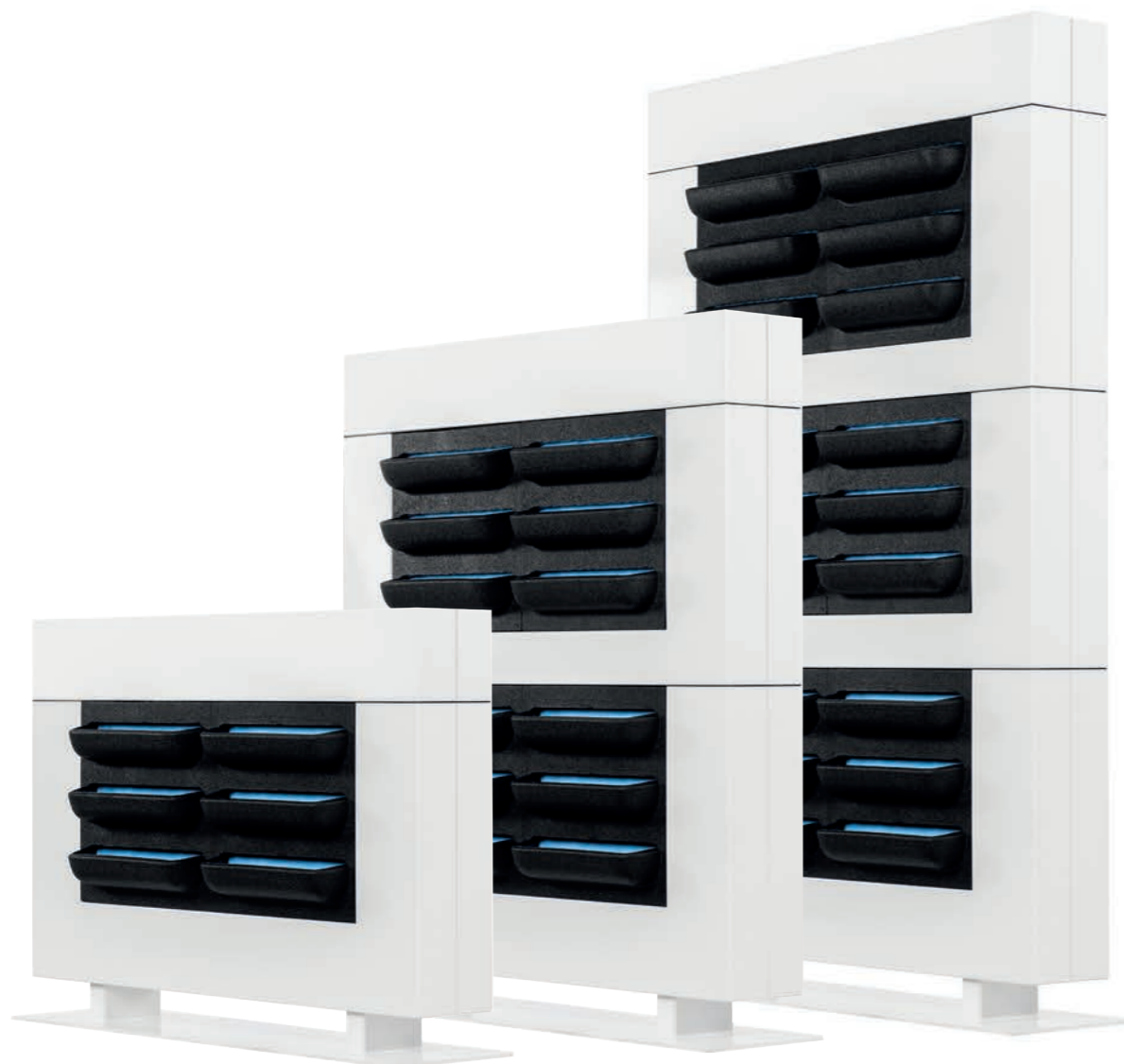
LIVEDIVIDER PLUS 1